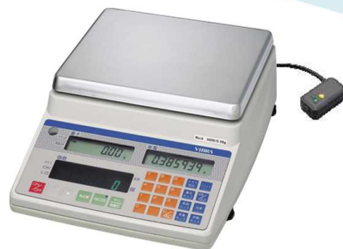
新光電子製 CUX II

Bluetoothを使って、ハカリで量った重量や個数をプリンターに送信します。ハカリとプリンターは離れていても大丈夫です！