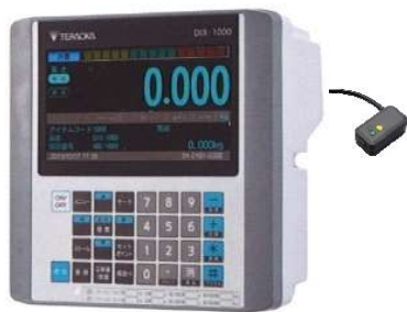
寺岡精工製 DIXシリーズ

(株)寺岡精工の台秤 DIXシリーズにブラザー販売(株)のラベルプリンターTD-2130NSAを接続して、 量った重量やハカリに登録した品名をラベルに印字する事が出来ます。