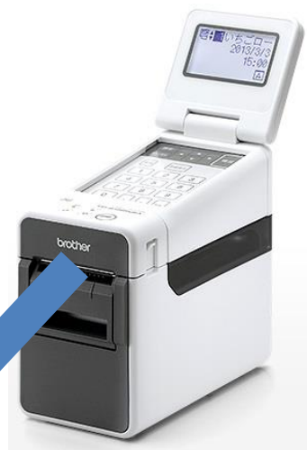
ブラザー販売(株)製 TD-2130NSA

ラベルに印字する項目や文字の大きさは、添付のパソコンソフトで設定する事が出来ます。