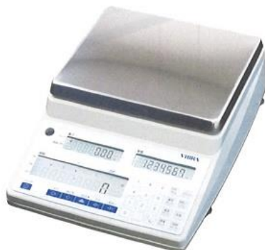
新光電子(株)製 CUXシリーズ

ディジ・テック(株)製Bluetoothアダプターを使って、ハカリで量った重量や個数をプリンターに送信します。ハカリとプリンターは離れていても大丈夫です！